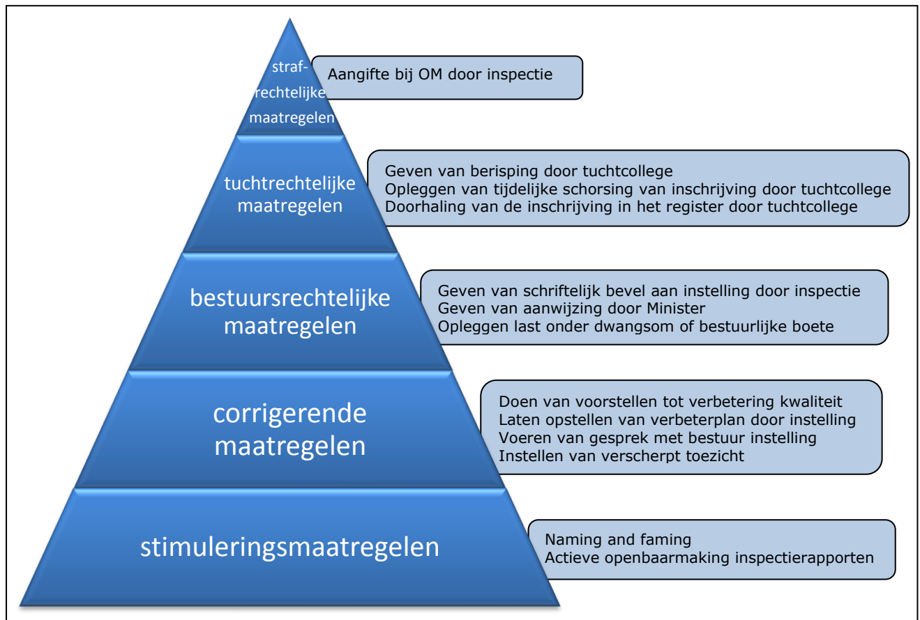
Figuur 3: interventiepiramide

Bestuursrechtelijke maatregelen zijn interventies die tot doel hebben een tekortkoming ongedaan te maken. Dit geschiedt door toepassing van wettelijke dwangmiddelen door de inspectie.