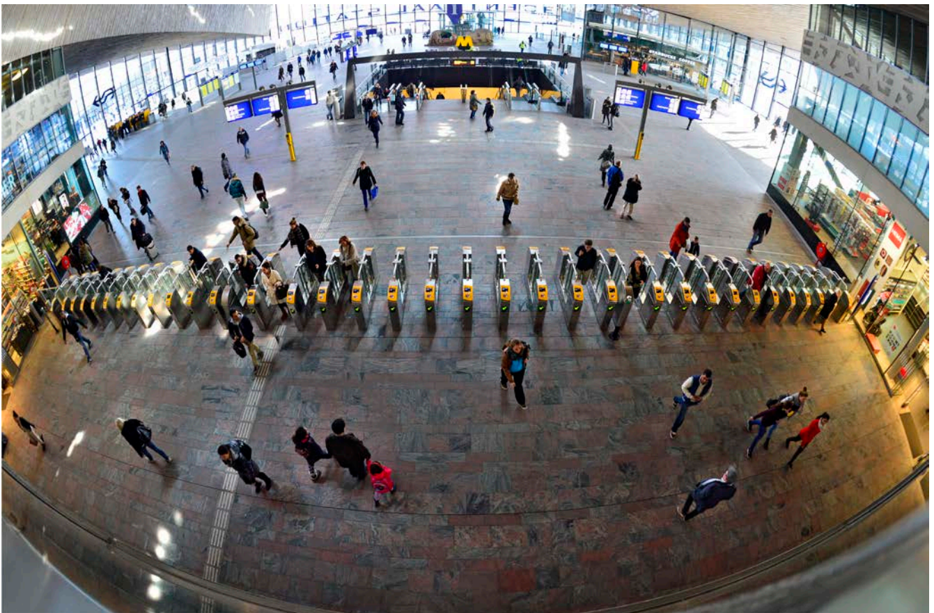
Afbeelding 2.