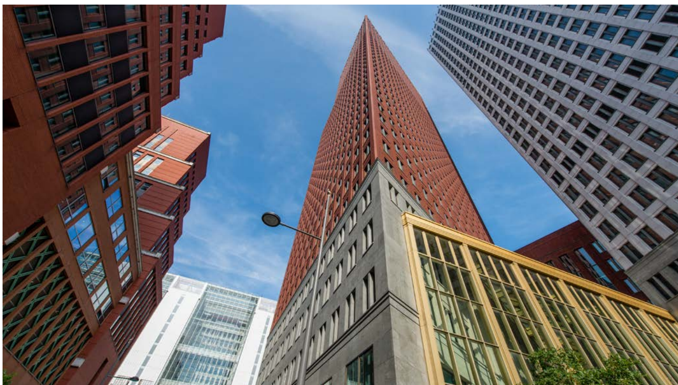
Afbeelding 21.

De Inspectie bestaat inmiddels vijf jaar. In die periode is het toezichtveld in de breedte toegenomen. Zo heeft de Inspectie in 2014 de verantwoordelijkheid gekregen voor het toezicht op de gehele vreemdelingenketen. In 2015, met de inwerkingtreding van de Jeugdwet, werd het toezicht uitgebreid met sanctietoepassing voor jeugdigen. De uitbreiding van taken betekende een uitdaging voor de Inspectie om die structureel geborgd te krijgen, kwalitatief en kwantitatief.