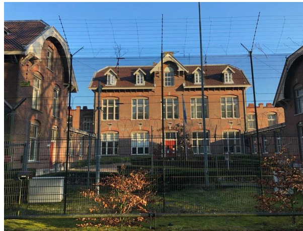
Een Justitiële Jeugdinstelling.

wie (welk deel van) het probleem kan oplossen. We kijken daarbij niet alleen naar de uitvoeringsorganisatie als opdrachtnemer, maar benoemen waar relevant ook de rol van de eigenaar en opdrachtgever. Een problematische taakuitvoering vraagt om een andere manier van werken door de organisaties die onder het toezicht vallen. Bijvoorbeeld door naar andere oplossingen te kijken als het personeel er niet is. Deze andere manier van werken heeft ook geleid tot een andere focus in het werk van de Inspectie en een ander effect. Hieronder wordt dit uitgelicht aan de hand van voorbeelden uit het toezicht op Justitiële Jeugdinstellingen (JJI's) en de aanpak van de Covid-19 crisis door de veiligheidsregio's.