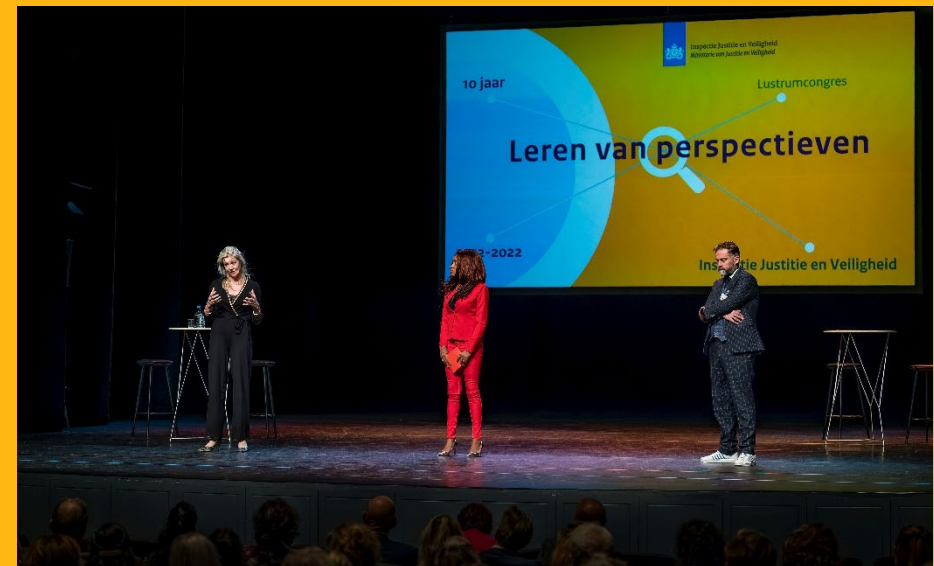
Tweede lustrum congres (oktober 2022)

toezicht vallen. Informatie-uitwisseling kan sterk bevorderd worden door actualisering van wet- en regelgeving over onze taken en bevoegdheden (zie ook hoofdstuk 2). Dit behoeft vooral aandacht bij onderdelen binnen strafrechtketen en het toezicht op de vreemdelingenketen. Het verkrijgen van data is onmisbaar voor goed toezicht.