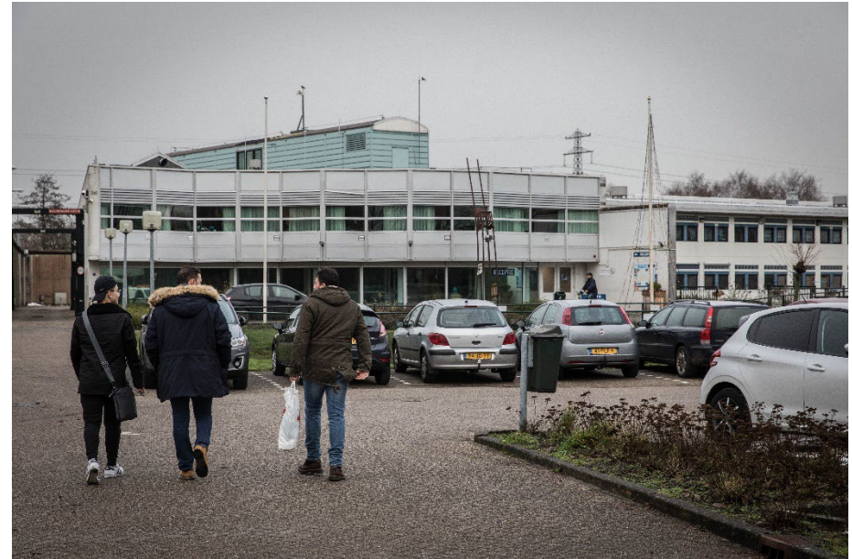
Handavings- en toezichtlocatie Hoogeveen.

bijvoorbeeld in de begeleiding van vreemdelingen met psychiatrische en/of verslavingsproblematiek.