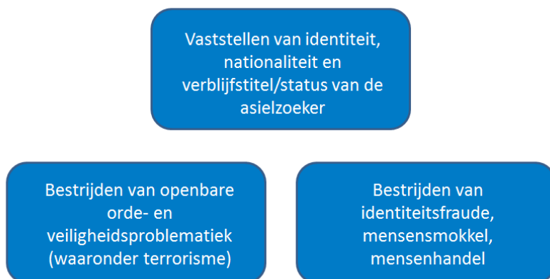
Afbeelding 1. Doelstelling identificatie- en registratieproces

Het identificatie- en registratieproces van de politie en de KMar heeft als primaire doelstelling de vaststelling van identiteit, nationaliteit en verblijfstitel/status van de asielzoeker. Daarnaast wordt bijgedragen aan het bestrijden van onder meer mensensmokkel, mensenhandel en openbare orde- en veiligheidsproblematiek (waaronder terrorisme) 2 .