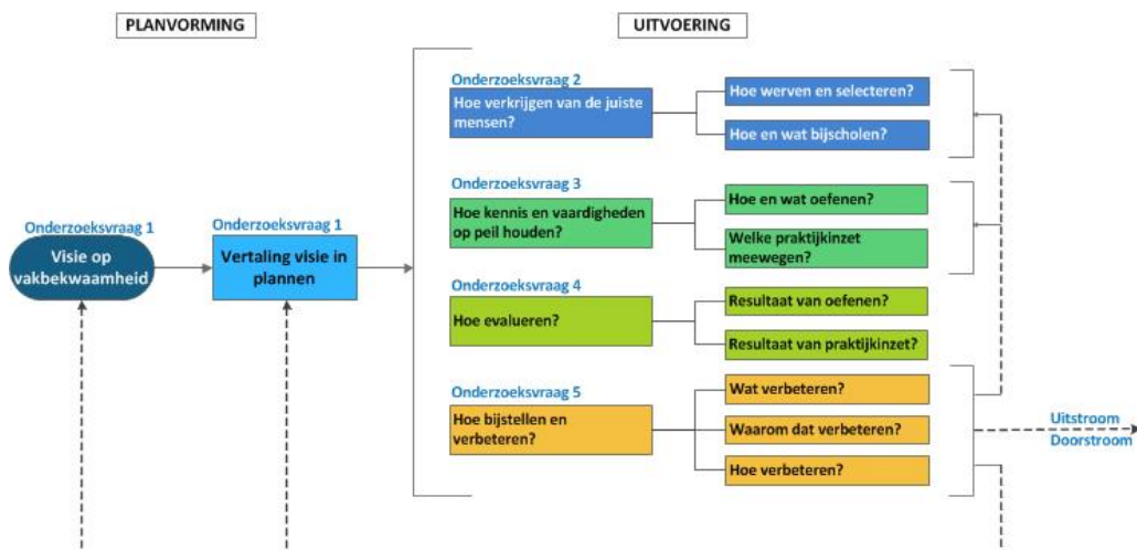
Afbeelding 2. Conceptueel model onderzoek borging vakbekwaamheid crisisfunctionarissen

De Inspectie heeft voor de uitvoering van het onderzoek de 'loop' vertaald in een conceptueel model waarin de vijf onderzoeksvragen zijn opgenomen.